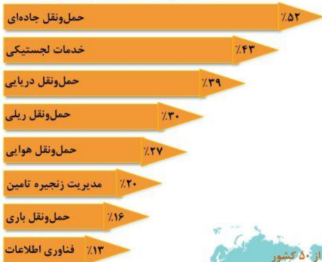
توزیع علاقه مندی بازدیدکنندگان